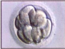
جنين في مرحلة ثمانية خلايا