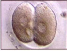
جنين في مرحلة الخليتين

عادة يتم نقل (1-3) من الأجنة إلى رحم الزوجة خلال دورة الإخصاب خارج الرحم ولكن في بعض الدورات العلاجية يمكن توفير أكثر من ثلاثة أجنة وعليه فإن الغرض من تجميد الأجنة الفائضة هو تخزينها والإحتفاظ بها بما يعزز من فرص نجاح الدورة العلاجية أو يتيح للزوجين فرصة إنجاب أطفال آخرين مستقبلاً بإذن الله.