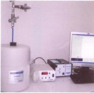
نوع آخر لأجهزة تجميد الأجنة

ستقوم وحدة الإخصاب والذكورة بالاتصال بالزوجين عند إكتمال فترة السنتين لمعرفة رغبتهما في التصرف في تلك الأجنة لذا فإنه من المهم جداً تحديث بيانات الإتصال بالزوجين بشكل دائم حيث أنه إذا تعذر الوصول للزوجين فإنه سيكون من حق البرنامج التخلص من تلك الأجنة بالطرق المشروعة.