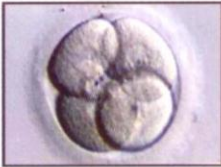
جنين في مرحلة أربعة خلايا