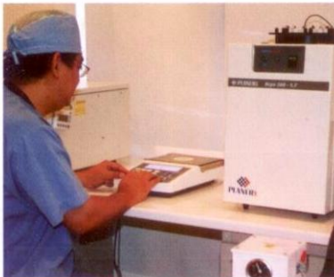
جهاز تجميد الأجنة

1. قد لا تبقى الأجنة صالحة بعد عملية التجميد. تشير الإحصائيات إلى أن (10٪) فقط من الأجنة تجتاز مرحلة التجميد وفك التجميد بنجاح.