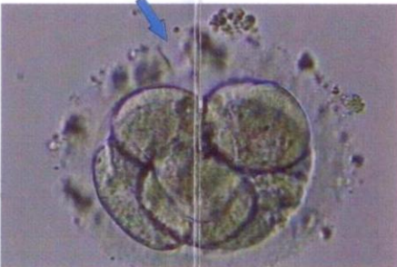
8 cell embryo after hatching