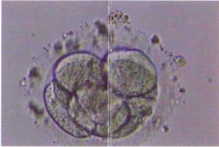
8 cell embryo before hatching