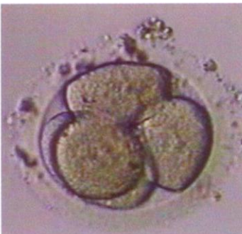
جنين في مرحلة أربع خلايا