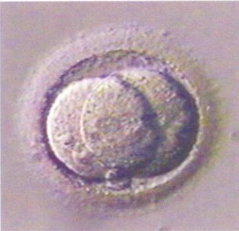
جنين في مرحلة خليتين

بعض البويضات لها أغشية ضعيفة أو صعبة الإختراق وقد يؤدي إدخال الإبرة الزجاجية بها إلى إتلاف الغشاء وعدم تلقيح البويضة.