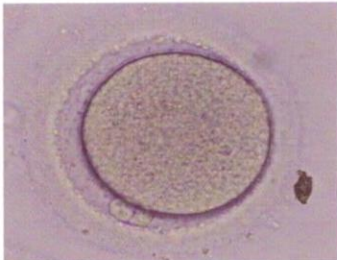
البويضة قبل الحقن المجهري

٢. في حالة عدم حدوث تلقيح للبويضة في العملية التقليدية للإخصاب خارج الرحم (IVF) قد تكون هناك مشكلة في إختراق الحيوانات المنوية للبويضة وتخصيبها. يساعد الحقن المجهري للحيوان المنوي داخل البويضة في تعزيز فرص تخصيب البويضة بإذن الله.